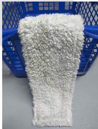
Abb. 2 Wischmop

In zwei Brandfällen waren eindeutig fettverschmutzte Wischmops die Ursache für umfangreiche Evakuierungsmaßnahmen in einem Klinikzentrum sowie in einem Universitätsversorgungszentrum entstand ein Sachschaden in Millionenhöhe.