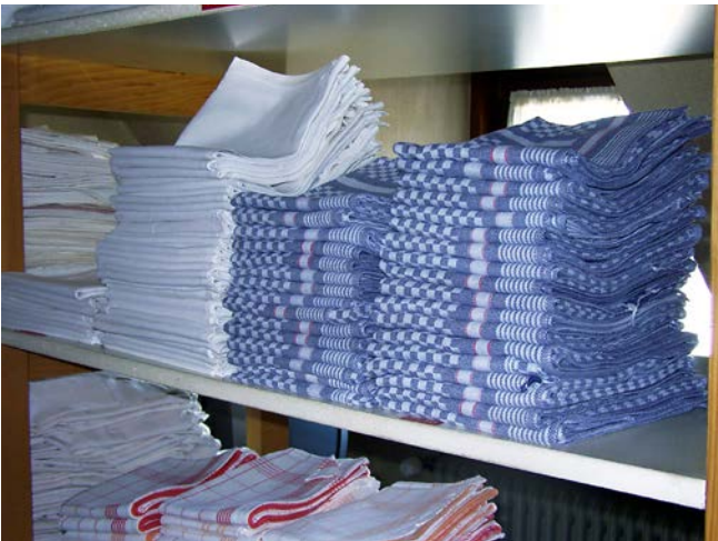
Abb. 1 Gestapelte Wäsche im Wäschelager

Textilbrände durch Selbstentzündung von Wäschestapeln oder von Wäsche im Trockner sind mehrmals im Hotel und Gastgewerbe vorgekommen. Verantwortlich für die Selbstentzündung sind Rückstände von ungesättigten Fettsäuren in den gewaschenen Textilien. Unter bestimmten Voraussetzungen kann es zur Selbsterwärmung bis hin zur Selbstentzündung dieser Textilien kommen, wenn direkt nach dem Trocknen im Trockner bzw. nach dem Heißmangeln die noch warmen Wäschestücke übereinander gestapelt oder verpackt werden.